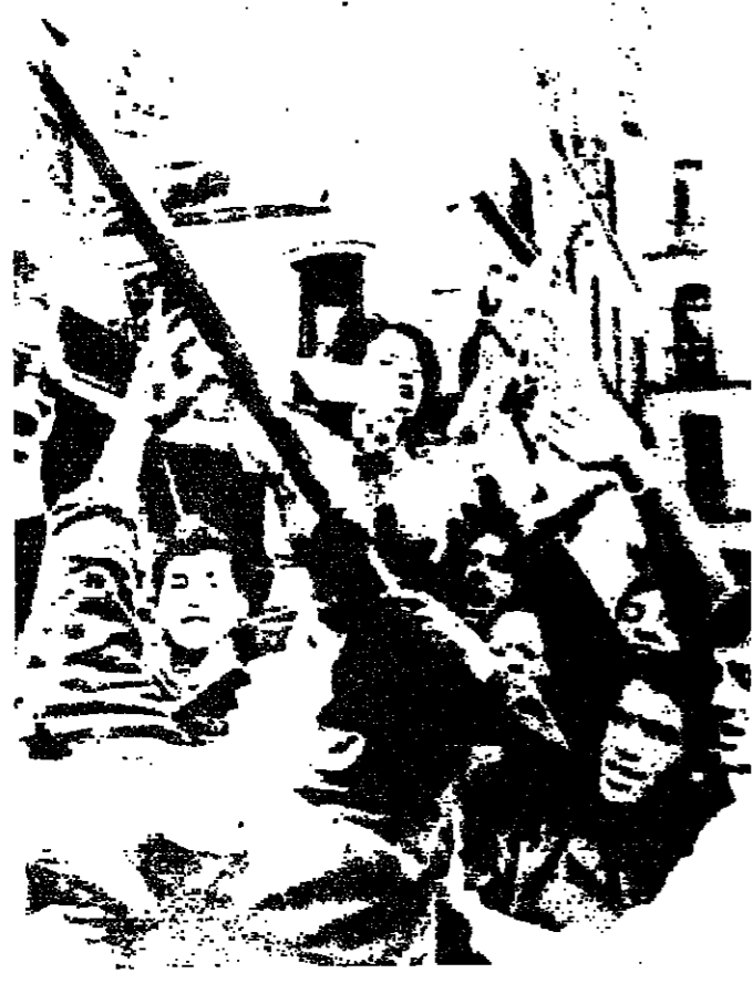
كسل السلطة للسينما الجديدة

استمرارا حثيا مع تيارات مختلفة والواقع على هذه الحقيقة كثيرة - في الشبلي مثلا - والشبه نفسه بالنسبة الى الشركات التجارية الاستغلالية التي تعمل على انتاج افلام غير ملتزمة ببداياتها وخصيصة شياطينها في ذلك جمع اكبر كمية من الربح المادي - وكذلك المؤسسات التابعة للدولة ويسيطر عليها نظام سياسي معين من شأنه قتل الواهب والمبادرات الطيبة - والحيولة دون تطور الفكر وتحول السينما - من تأثير النظم الاستغلالية - فما العمل ان ؟